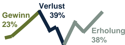
Abb. 1